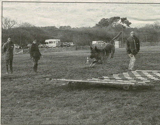
● Le saut en longueur se déroulait, sous l'œil attentif du conducteur et des juges.