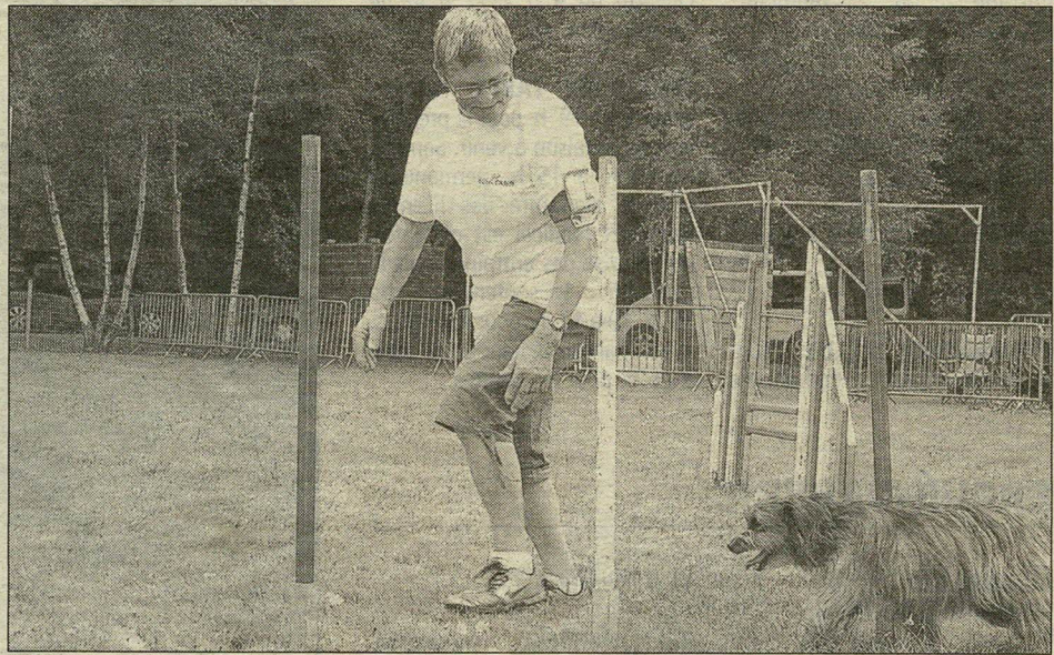
Passage du slalom : maître et chien dans la course.

Hier et samedi, sur le terrain de Toulven, le Club canin de l'Odet organisait son deuxième concours d'Agility de l'année, après celui proposé lors du festival de l'élevage.