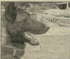
En attendant, je regarde les autres faire...